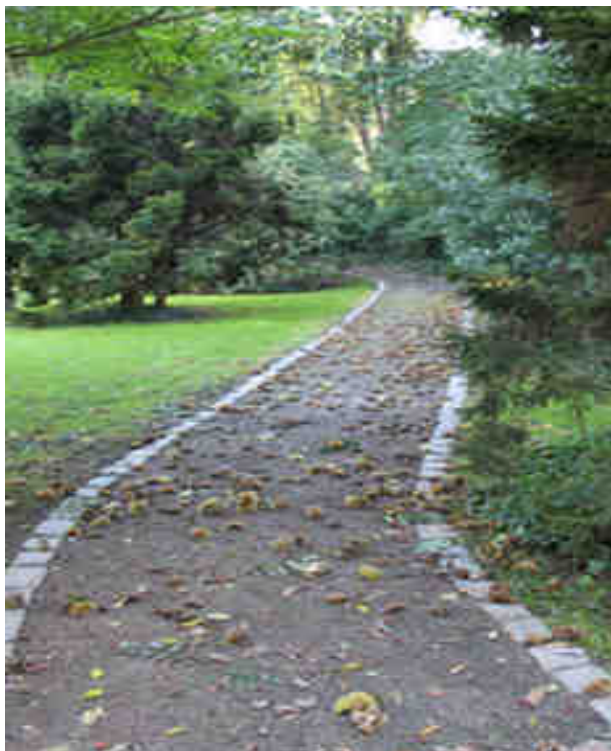
Der idyllische Spazierweg durch Ramées Park.

Man hört sie schon, die da höhnen, ob denn die SPD-Fraktion nicht wichtigeres zu tun hätte und ob sie denn noch auf der Höhe der Zeit sei, wenn sie sich um die Durchsetzung eines Gerechtes kümmern. Natürlich gehören solche Initiativen nicht zum Kernbereich sozial-demokratischer Programmatik. Aber sie sind Ausdruck unserer kommunalpolitischen Verantwortung und Verpflichtung, uns der Sorgen und Ärgernisse der Bürger vor Ort anzunehmen. Auch das ist Teil der Aufgaben und Programmatik der SPD in Altona.