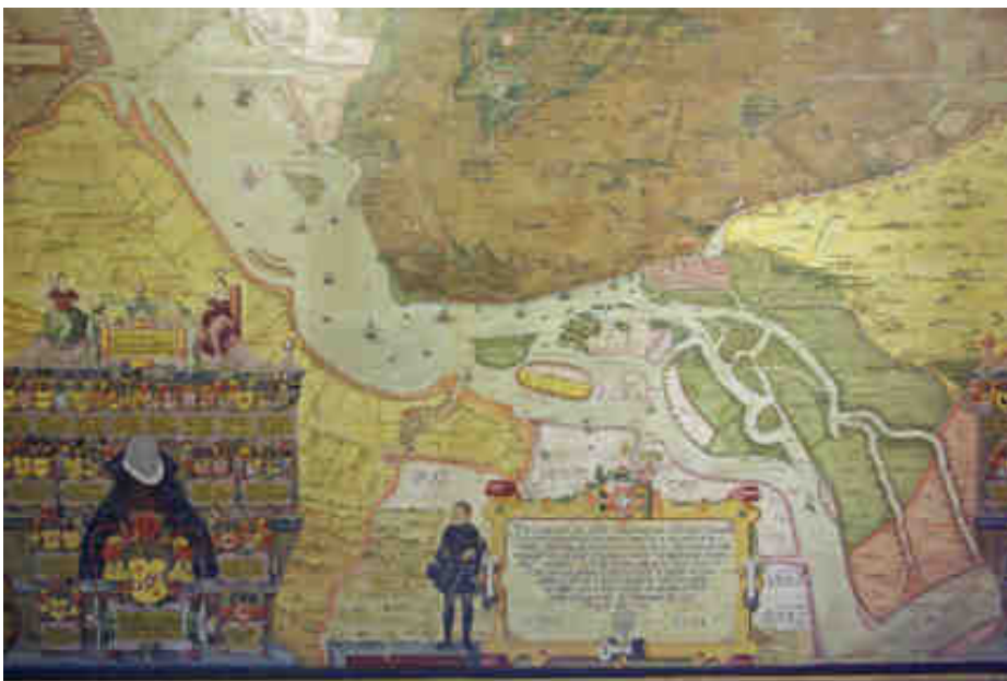
Die sogenannte Freese-Karte zeigt Hamburg im Niederelberaum im 16. Jahrhundert.

Verwaltungsakt abgeschnitten werden darf – insbesondere nicht nur zu Gunsten einiger kosten trächtiger Highlights. Die besondere Geschichte lässt sich gut an den reichhaltigen Schätzen und Exponaten des Museums ablesen: Landschaftsmalereien und Porträts, Exponaten zu Schifffahrt und Fischerei, Bauernstuben, Trachten und Kinderspielzeug, Fayencen und Haushaltsgegenständen aus mehreren Jahrhunderten sowie wichtige Bild- und Motivpostkarten. Über dem Haupt-Treppenaufgang hängt die sogenannte Freese-Karte vom Niederelberaum aus dem Jahre 1588. Der Niederelberaum steht auch im historischen und ökologischen Zentrum der vielfältigen Exponate des Museums.