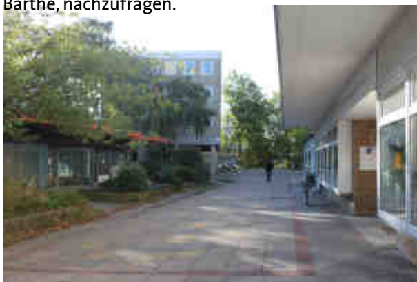
Auf dieser gegenwärtig noch öden Fläche plant der Investor das zukünftige Lurup-Center.