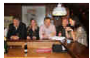
Entspannter Ausklang des Abends an der Theke

Als der erste Hunger gestillt war, spielte im Nebenraum des Heidbarghofes die Band „Rock die Straße“ auf und sorgte dafür, dass das Tanzbein geschwungen wurde. Die Feier dauerte bis in die Nacht an und es blieb bei den Gästen und uns Veranstaltern das Gefühl, dass es eine gelungene Veranstaltung war, bei der sich alle wohl gefühlt haben – und die bestimmt im nächsten Jahr eine Neuauflage erfährt, wenn es wieder heißt: Die SPD lädt ein zum „Roten Sommer“.