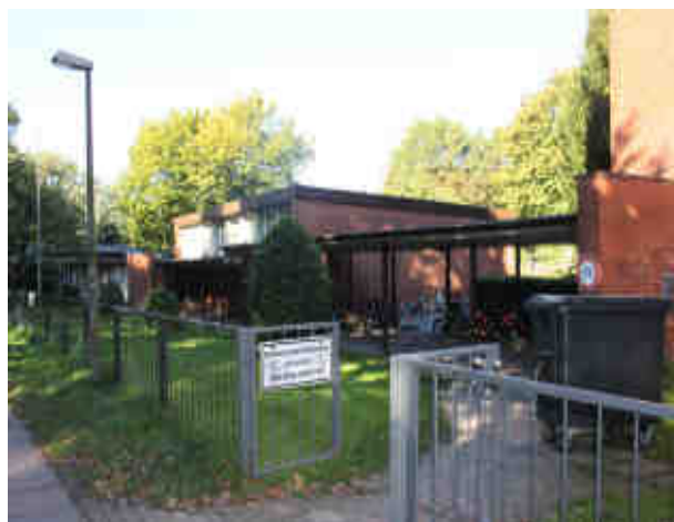
Nun doch keine Primarschule: Auch die Schule Mendelssohnstraße bleibt Grundschule.

Die Einzelheiten zu diesem Fall stammen allerdings nicht aus offiziellen Informationen der