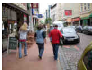
Die Bahrenfelder Straße ist bisher noch keine Gemeinschaftsstraße.

Die Diskussion über die Umgestaltung der Bahrenfelder Straße zu einer „Gemeinschaftsstraße“, auf der Fußgänger, Autofahrer und Radfahrer gleichberechtigt sind und sich per Blickkontakt verständigen, löst nicht nur in der Anwohnerschaft große Diskussionen aus. Nachdem sich mittlerweile 46 der 56 Einzel-