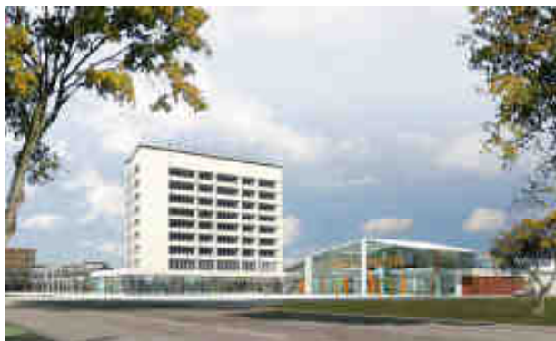
Derzeit noch ein Modell, aber die Arbeiten zur Umsetzung haben begonnen: So soll das neue Lurup-Center aussehen.

Barthe: Zusätzlich zu einem großen SB-Warenhaus, das neben Lebensmitteln auch Bücher, Kleidung und Weiteres anbietet, sind außerdem noch Einzelhandelsangebote mit Schuhen, Textilien, eine Apotheke sowie ein Drogeriemarkt vorgesehen. Über 70 Prozent der verfügbaren Fläche haben wir derzeit schon vermietet. Darüber hinaus sind Sortimente wie Blumen, Tabak und Zeitschriften, Schuh- und Schlüsseldienst sowie eine Reinigung angedacht. In den Außenbereichen möchten wir unter anderem Gastronomie ansiedeln. Der bisherige Parkplatz vor der Post entfällt und wird als fußläufiger Eingang zum Lurup-Center neu gestaltet. Ein Eiscafé oder ein anderer gastronomischer Betrieb soll hier zu einer Belebung des neugestalteten Platzes beitragen. Auf der anderen Seite am Marktplatz sind weitere 200 Quadratmeter Fläche für Gastronomie vorgesehen.