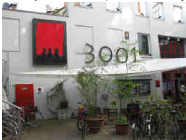
Auch das ist die Schanze: Das beliebte Programmkinos „3001“ in einem Innenhof.

und friedliches Schanzenfest waren damit von Seiten des Bezirkes gegeben. Die Innenbehörde ließ den Bezirk gewähren. Auch auf Nachfrage gab es seitens der Behörde keine Anweisung anders zu Verfahren. Das Fest 2009 fand dann leider wie gewohnt statt.