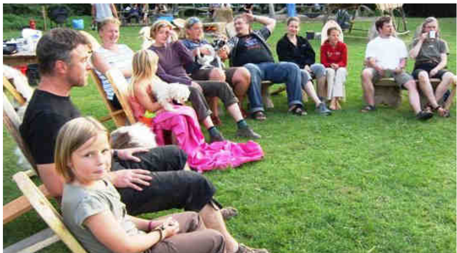
Auch die Südjütländer zeigen Interesse an einer Partnerschaft mit Altona.

Anfang August besuchten wir den Jugendhof Knivsborg e.V. in Rodekro im dänischen Südjütland, um erste Kontakte bezüglich einer zukünftigen Partnerschaft zwischen Altona und einer jütländischen Kommune zu knüpfen. Im Verlauf dieser Gespräche kristallisierten sich die Kommunen Tondern, Apenrade und Sonderburg für eine mögliche Partnerschaft heraus. Um die Kontakte zu vertiefen und das Projekt weiter voran-