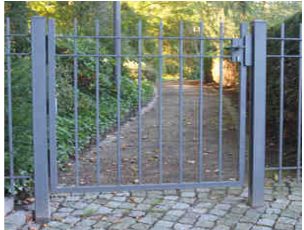
Tür zu? Nein, ab jetzt ist die Tür zu Ramées Park auf!

Im vorliegenden Falle muss gelten: Gesetz ist Gesetz. Auch der Bebauungsplan Nienstedten 20 ist ein Gesetz. Er sieht seit vielen Jahren ein öffentliches Gehrecht für Fußgänger von der Christian-F.-Hansen-Straße vorbei am Elbschlößchen durch die kleine Parkanlage östlich der ehemaligen Neuen