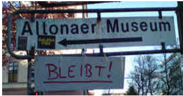
Das Altonaer Museum soll bleiben!

Aus Altonaer Sicht besonders fatal ist: Schon im nächsten Jahr soll das Altonaer Museum geschlossen werden. Damit will der Senat 3,4 Mio. Euro sparen. Dagegen haben sich sowohl die Altonaer Bevölkerung als auch die Bezirksversammlung aufgelehnt, da es um das geschichtliche Herz Altonas geht. Es ist wieder ein Beispiel für die planlose und konfuse Kahlschlagspolitik von CDU und GAL: Erst bis vor zehn Monaten wurden der Eingangsbereich und das Foyer des Museums für drei Mio. Euro aufwändig umgestaltet. Die ehemalige Kultursenatorin Frau Prof. von Welck sagte bei der Wiedereröffnung: „Der neue Eingangsbereich ist eine gelungene Verbindung zwischen zeitge-