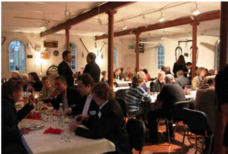
Angeregte Unterhaltungen bei knusprigem Grillfleisch und leckeren Getränken