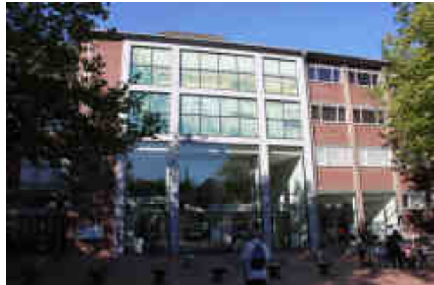
Das Altonaer Museum ist direkt von der Schließung betroffen.

sammlung gewählten Leiter abzuschaffen. Eine Abschaffung wäre aber klar verfassungswidrig, das haben Verfassungsrechtler wie Prof. Bull schon erklärt. Nicht umsonst haben es die Bezirksvertreter 2006 geschafft, die Bezirke und die Bezirksämter in die Verfassung